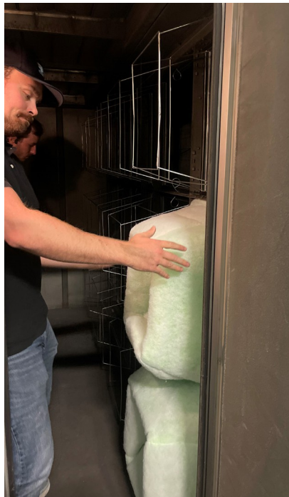
Installation du Tri-Cube RFX avec poche centrale sur le matériel de fixation