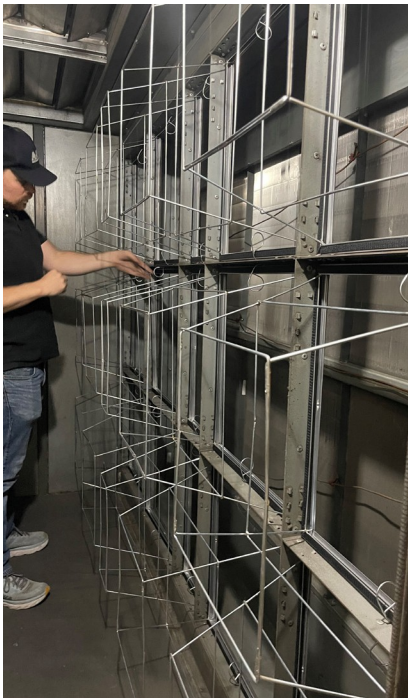
Matériel de fixation permanent Tri-Cube RFX de MANN+HUMMEL